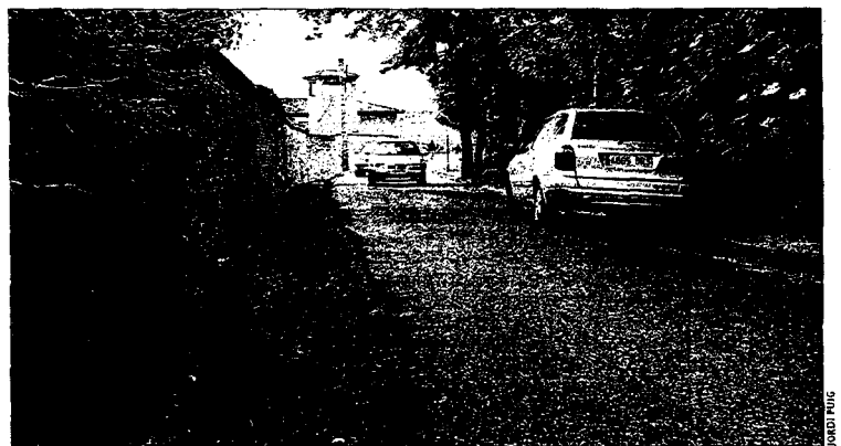
No hi ha vorera. Quan es creuen dos cotxes, si a més passa un vianant, el perill es multiplica

autèntic perill. Quan s'hi creuen dos cotxes gairebé s'han d'aturar perquè passen molt justos i si, a sobre, hi ha un vianant el problema es multiplica. Aquesta carretera, a més, és molt utilitzada per persones que van a camïnar de Manlleu cap a la zona del Vicens, a les Masies de Roda. A l'últim revolt, on fa anys hi va haver una topada mortal entre un camió i una moto, s'hi va construir una illeta.