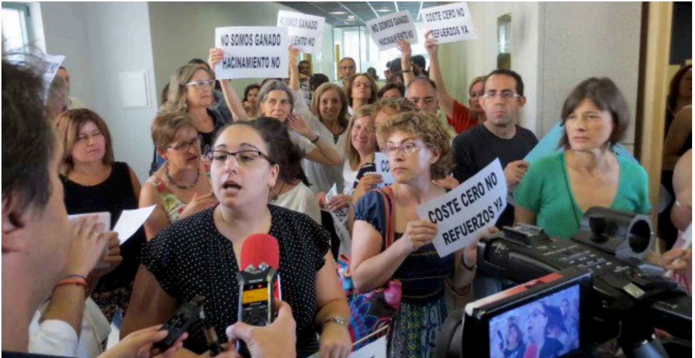
Trabajadores de los Juzgados de Ponferrada, durante la protesta de ayer por la falta de personal y el hacinamiento en algunas oficinas.