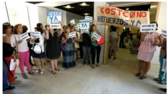
Protestas de los funcionarios para pedir refuerzos.