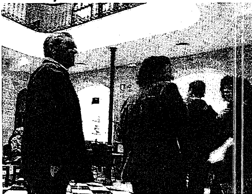
Jerezanos hacen cola a principios de 2008 en la oficina del Catastro para reclamar los valores de sus inmuebles. ASQUAL

Al hilo de las informaciones publicadas por este medio, el Colegio de Abogados entiende que el proceso podría haberse cerrado de no ser por la "intromisión" política, lo que posiblemente provocó que la Abogacía del Estado presentara recurso de nulidad contra la sentencia emitida al filo del plazo para que el fallo judicial fuera firme.