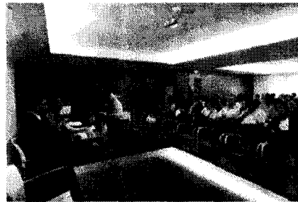
La primera jornada del congreso tuvo lugar ayer en un hotel de Platja d'en Bossa.

IBIZA | J. LL. FERRER Cerca de un centenar de profesionales del derecho y otros juristas de toda España celebran entre ayer y hoy el VI Congreso de Responsabilidad Civil, en el que se analizan las últimas novedades sobre todo lo relativo a la reclamación y pago de indemnizaciones por cuestiones relativas a accidentes de tráfico, quejas sobre consumo, actuación de la administración o funcionamiento de negocios y actividades específicas. Hoy se abordará, entre otras cuestiones, la responsabilidad civil en discotecas y en cirugía estética, dos asuntos que generan un gran número de quejas y reclamaciones de resolución en ocasiones compleja.