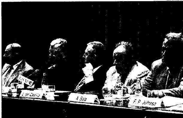
Los candidatos al decanato del Colegio de Barcelona durante un debate electoral organizado por la escuela de negocios ESADE.

puestas de austeridad forman parte de todos los programas electorales.