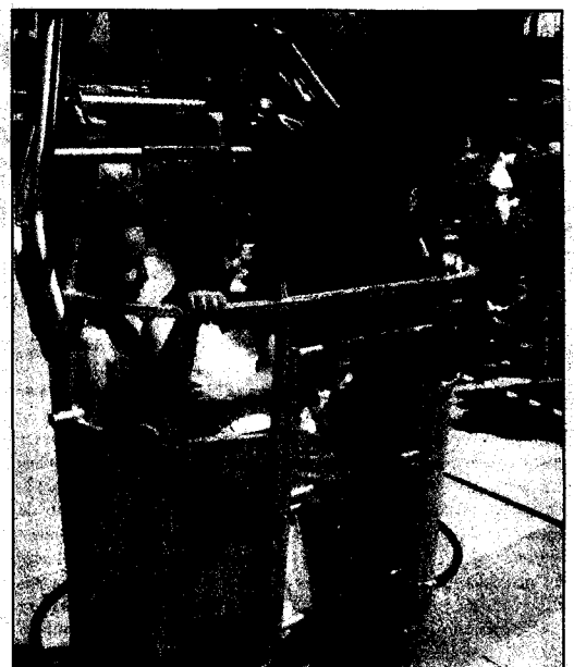
Los menores pudieron conocer de cerca la labor de los Cuerpos. M.E.

"Hemos diseñado una actividad muy amena que permite que niños a partir de cinco años y alumnos de más edad perciban de una forma más cercana a los miembros de estos Cuerpos de Seguridad, confíen en ellos y los tengan como referencia en el caso de que se produzcan una emergencia", manifestó la también primera teniente de alcalde de Marbella a través de un comunicado de prensa.