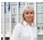
La Comisaria de Mercado Interior, Elżbieta Bienkowska

La Comisión Europea ha decidido iniciar procedimientos de infracción contra varios Estados miembros de la UE, entre los que se encuentra España, debido a que la legislación nacional contiene obstáculos excesivos e injustificados en el ámbito de los servicios profesionales. La Comisión considera, en línea con anteriores Recomendaciones del Semestre Europeo, que los requisitos que han de cumplir determinados prestadores de servicios son contrarios a la Directiva 2006/126/CE relativa a los servicios en el Mercado Interior. En el caso concreto de España, se trata de las tarifas mínimas obligatorias para los procuradores y determinadas actividades de los procuradores que son incompatibles con las de los abogados. La comisaria europea de Mercado Interior Elżbieta Bieńkowska declaró: « La libre prestación de servicios es uno de los pilares del mercado único. En algunos Estados miembros siguen existiendo barreras —ya sea en forma de restricciones a la forma jurídica y la participación en el capital o de requisitos en materia de titulaciones o tarifas fijas— que la impiden. Hoy, no solo estoy lanzando una advertencia; estoy enviando un mensaje de oportunidad: un mercado único de servicios profesionales dinámico conducirá a una economía europea más competitiva ». La carta de emplazamiento es la primera etapa del procedimiento de infracción y constituye una petición oficial de información. Los Estados miembros disponen de dos meses para responder.