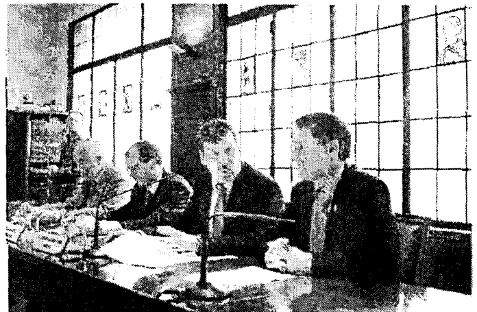
Representantes de la nueva junta rectora de la Agrupación. OLIVER DUCH