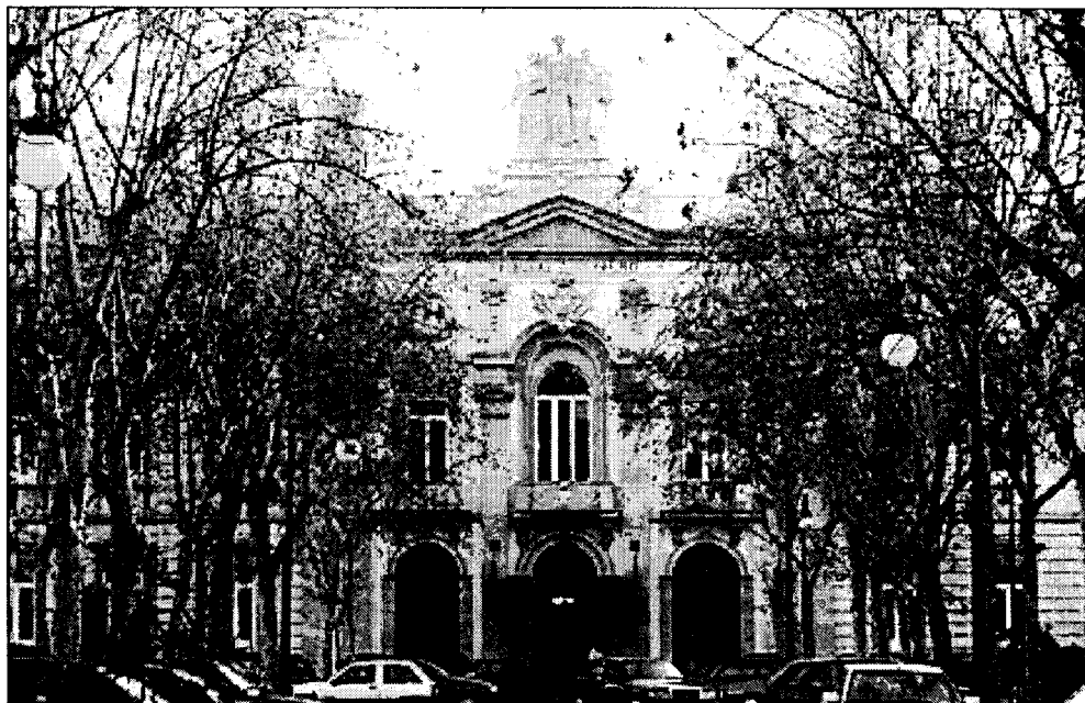
Edificio sede del Tribunal Supremo, que en 2006 anuló el anterior modelo de retribución variable de los jueces.

Para llegar a esa conclusión ambos investigadores han estudiado las evaluaciones de rendimiento de 4.000 jueces españoles desde 2003 a 2008 y el modo en que han incidido en ellas ambos modelos de retribución variable. Así, los datos revelan que la puesta en práctica del modelo de 2004 dio lugar a un aumento de la productividad media del co-