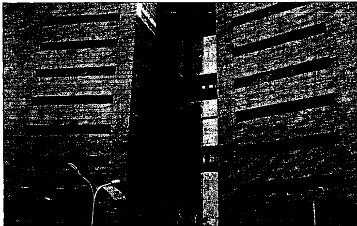
La Audiencia Provincial de Melilla se vería afectada si se aplicase estrictamente la ley.