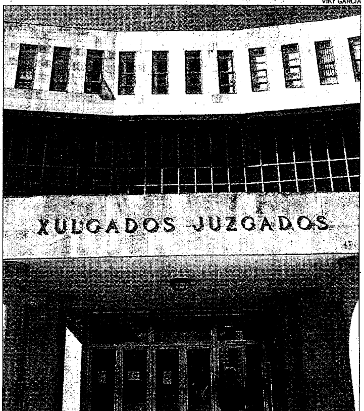
Exterior del edificio que alberga la sección sexta de la Audiencia

Advierten, además, "de las graves consecuencias que puede originar la tendencia a la especialización de materias jurisdiccionales (mercantil, familia y violencia de género, por el momento)". Según los decanos "con ello se vacía parcialmente de contenido competencial a las secciones desplazadas, a la