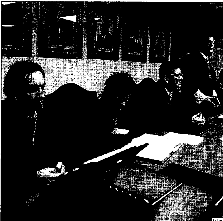
La junta de gobierno del Colegio de Abogados, en la imagen, analizará la medida.