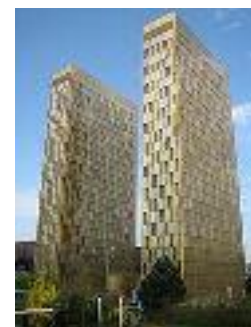
Sede del TJUE en Luxemburgo

El TJUE ha dictado sentencia en el asunto C-362/14, la llamada sentencia sobre “puerto seguro” o “ Safe Harbor ”, también conocida por implicar a la red social Facebook. La STJUE estima que la existencia de una Decisión de la Comisión, que declara que un país tercero garantiza un nivel de protección adecuado de los datos personales transferidos, refiriéndose a Estados Unidos, no puede dejar sin efecto ni limitar las facultades de las que disponen las autoridades nacionales de control de datos, en virtud de la Carta de los Derechos Fundamentales de la UE y de la Directiva de Protección de Datos. Por ello estas autoridades deben poder apreciar con toda independencia si la transferencia de los datos de una persona a un país tercero cumple las exigencias establecidas por esta Directiva. Por otro lado, el TJUE ha examinado la validez de la Decisión de la Comisión Europea, sobre el llamado “puerto seguro” y ha estimado que es inválida, ya que prevalecen sobre el régimen de puerto seguro las exigencias de seguridad nacional, interés público y cumplimiento de la ley de Estados Unidos, permitiendo de esta forma a las autoridades públicas norteamericanas acceder de forma generalizada al contenido de las comunicaciones electrónicas, sin prever posibilidad alguna de que el justiciable ejerza acciones en Derecho para acceder a los datos personales que le conciernen o para obtener su rectificación o supresión.