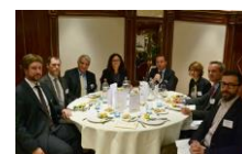
Mesa presidencial del Almuerzo debate con la Comisaria Malmstrom

La Cámara Oficial de Comercio de España en Bélgica y Luxemburgo organizó ayer 12 de octubre un almuerzo-debate con Cecilia Malmström, Comisaria Europea de Comercio, sobre la Nueva Política de Comercio de la UE y las implicaciones de acuerdos comerciales como el TTIP. La Delegación en Bruselas de la Abogacía fue invitada a compartir mesa con la Comisaria, e igualmente acudieron representantes de otras Abogacías europeas, abogados, y directivos de numerosas empresas españolas, entre otros. Malmström presentó la nueva Política de Comercio de la UE, explicando que se trata de un nuevo planteamiento de aproximación a las relaciones comerciales internacionales, que refleja los valores de la UE, centrándose en la eliminación de barreras y aranceles comerciales. También prometió incrementar la transparencia de todos los acuerdos. En la segunda parte de su intervención, se centró en la Asociación Transatlántica de Comercio e Inversión (TTIP). La describió como “necesaria y vital” para las relaciones entre EEUU y la UE. Igualmente, Malmström mencionó los numerosos acuerdos que la UE mantiene a nivel comercial, para destacar aquéllos que deben actualizarse o desarrollarse con estados clave del Sudeste asiático o Latinoamérica. Tras la ponencia, se dio paso a un turno de preguntas. Los asistentes plantearon numerosas dudas a la Comisaria, relativas a la protección y transferencia de datos y al desarrollo de posibles nuevos acuerdos comerciales con Túnez, India y China.