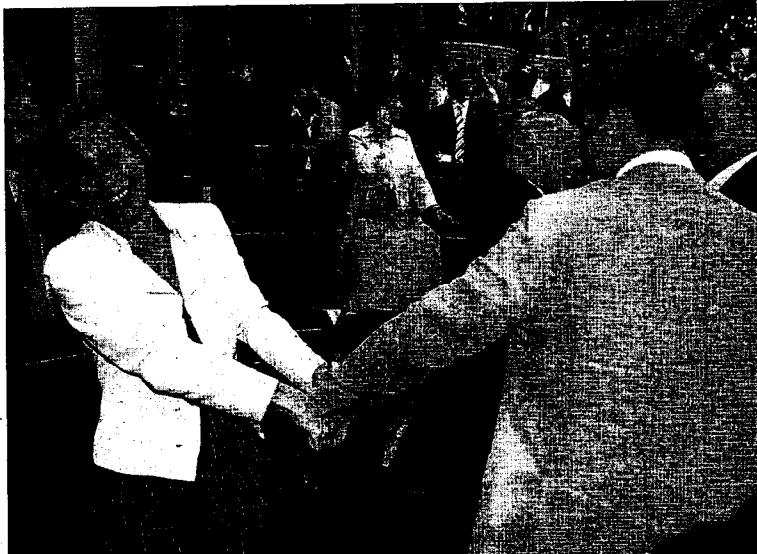
La consejera del Interior, la socialista Montserrat Tura, celebra la aprobación del proyecto.

d) La gestión de la parte de los recursos hídricos y de los aprovechamientos hidráulicos que posea por Cataluña, de acuerdo con lo que establecen los apartados 1 y 2.