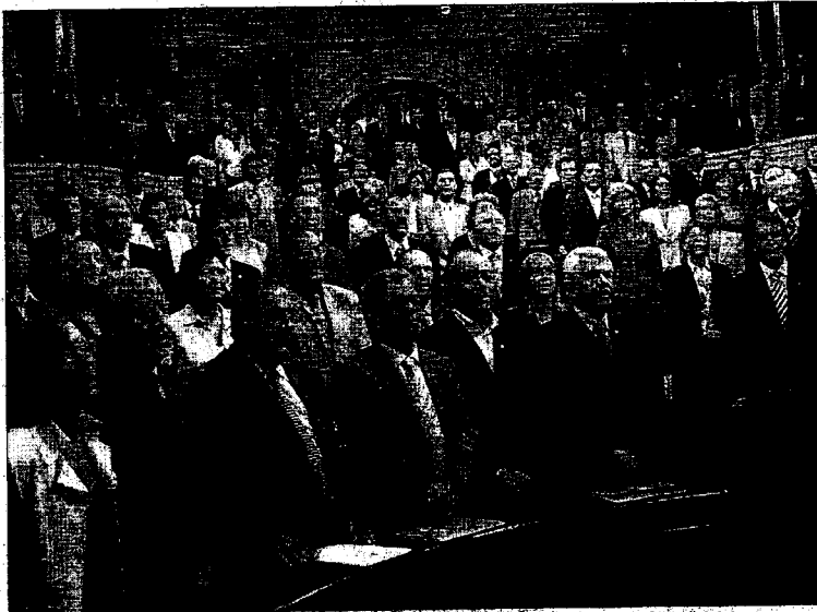
Parlamentarios catalanes y los miembros del tripartito, catalán el mismo de Cataluña tras la aprobación del Estatut.

La vocación y el derecho de los ciudadanos de Cataluña de determinar libremente su futuro como pueblo, que el Parlamento de Cataluña ha expresado reiteradamente, se corresponde con la afirmación nacional que históricamente representó la institución de la Generalitat, vigente hasta el siglo XVIII y después recuperada y mantenida sin interrupción como máxima expresión de los derechos históricos de que dispone Cataluña y que el presente Estatut incorpora y actualiza. Hoy Cataluña, en su proceso de construcción nacional, expresa su voluntad de ser y de seguir avanzando en el reconocimiento de su identidad colectiva y en el perfeccionamiento y la am-