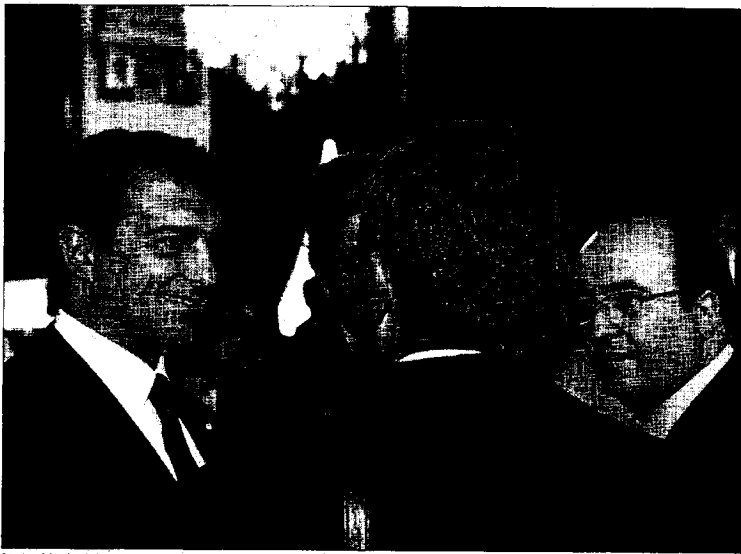
El presidente del Barça, Joan Laporta (izquierda), y el 'número dos' y portavoz parlamentario del PSC, Miquel Iceta.

ARTICULO 205.3 La Agencia Tributaria de Cataluña puede ejercer por delegación de los municipios las funciones de gestión tributaria con relación a los tributos locales.