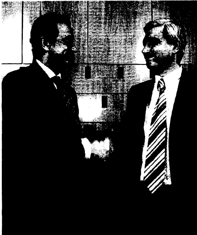
El alcalde y el decano de los abogados firmaron el convenio.

En los ochenta primeros días desde su apertura, el primer juzgado específico sobre el tema dictó ochenta órdenes de protección, tal como adelantó este periódico a principios de octubre.