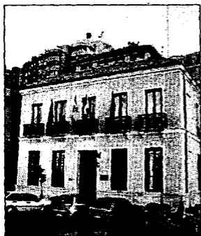
Sede del Colegio de Abogados.

► Sólo 27 ciudadanos acudieron ayer al Colegio de Abogados a hacer consultas sobre problemas legales en la jornada de puertas abiertas que celebró la corporación para sensibilizar a la población de la necesidad de usar los servicios de los letrados en sus dudas ante la ley. La cifra fue muy inferior a la del año pasado, quizás por la lluvia, cuando más de 100 personas participaron en la jornada. Doce abogados atendieron preguntas sobre leyes de Familia, Extranjería, Arrendamientos Urbanos, Propiedad Horizontal y penales.