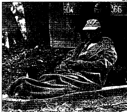
Un soldado marroquí descansa , en Farjana, junto a Melilla, donde vigila para evitar la concentración de inmigrantes.

Montaje grosero Marruecos salió al paso de las ONG que le reprochan