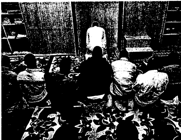
Hora del rezo. El imán dirige el momento más importante del día