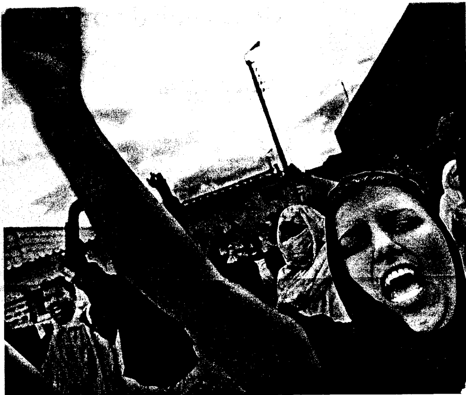
Manifestantes saharauis durante la protesta de ayer contra «la ocupación marroquí»

Los agentes que procedieron a la retención de los informadores negaron que se hubieran quedado con algunas