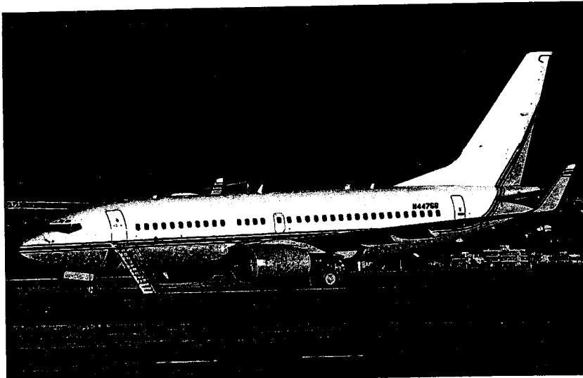
El Boeing utilizado por la CIA para sus secuestros, en el aeropuerto Son Sant Joan de Mallorca.

Aparte de estos casos, la Comisión Europea viene recibiendo desde hace años las denuncias de organismos humanitarios, con todo tipo de detalles y fechas, de que por aeropuertos europeos hacen escala regularmente al menos tres de los famosos aviones de la CIA. Ellos son el Boeing N313P (usa también la matrícula N4476S); el Gulfstream V N379P (o N8068V) y el Gulfstream IV N85VM (o N227SV). La CE parece por lo tanto no carecer de precedentes de acciones ilegales de la CIA en Europa como para tomar en serio las nuevas acusaciones.