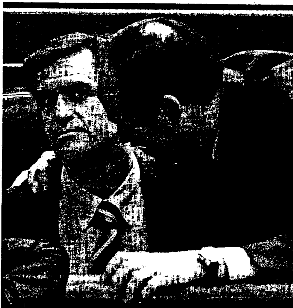
Bono y López Aguilar, ayer en el Congreso

«Defender a los países que son aliados y amigos no solamente lo hago con satisfacción, sino que es una obligación del ministro de Defensa», aseguró tras revelar que ayer habló con el embajador estadounidense, Eduardo Aguirre, «en un contexto más amplio y de otros asuntos».