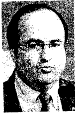
MIQUEL ICETA Vicet primer secretario del PSC

► Su formación jurídica y su espíritu autonomista le convierten en una pieza importante en el día a día. Zapatero le ha dado la confianza en detrimento de Jordi Sevilla.