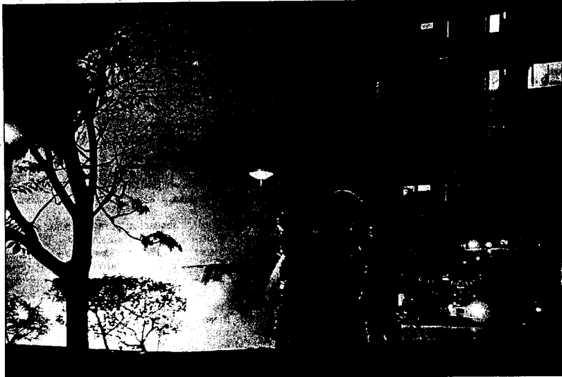
Los bomberos tratan de apagar el fuego que quema un coche en Venissieux, cerca de Lyon, anoche.

Al verse privados de movimiento, los jóvenes respondieron arrancando bancos, rompiendo cristales y utilizando todo cuanto estaba a su alcance como proyectil contra la policía. Fue una verdadera lluvia de piedras, cristales y hasta retrovisores de vehículos. Una hora des-