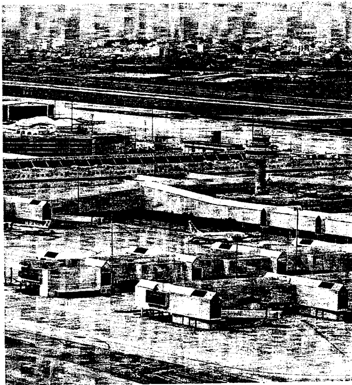
Vista del aeropuerto de Son San Joan, en Palma de Mallorca

privados, «se desconoce la actividad que desarrollaban sus ocupantes». Esto originó el archivo por parte del fiscal. Pero, además de en Palma de Mallorca, los aviones de la CIA también habrían hecho escala en los dos aeropuertos de Tenerife. Así, el periódico «La Opinión» informaba hace días que dos Gulfstream —también estuvieron en Son San Joan— aterrizaron en cin-