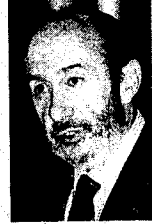
ALFREDO PÉREZ RUBALCABA Portavoz del PSOE en el Congreso

► Castells será el eje de la negociación del modelo de financiación catalán. Pese al rechazo cosechado por el proyecto, sigue convencido de que es políticamente viable.