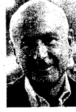
JOSEP ANTONI DURAN LLEIDA El hombre de CiU en las Cortes

► Su capacidad negociadora y pactista es conocida y durante este primer tramo de legislatura ha trabajado un entendimiento razonable con CiU, ERC e ICV.