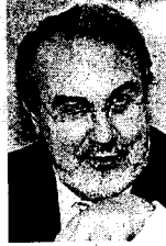
PEDRO SOLBES Vicepresidente del Gobierno

► Ridao es, posiblemente, uno de los políticos que más conocen el texto del Estatut. Su tésón le ha convertido en uno de los hombres de ERC que ya tratan con la Moncloa.