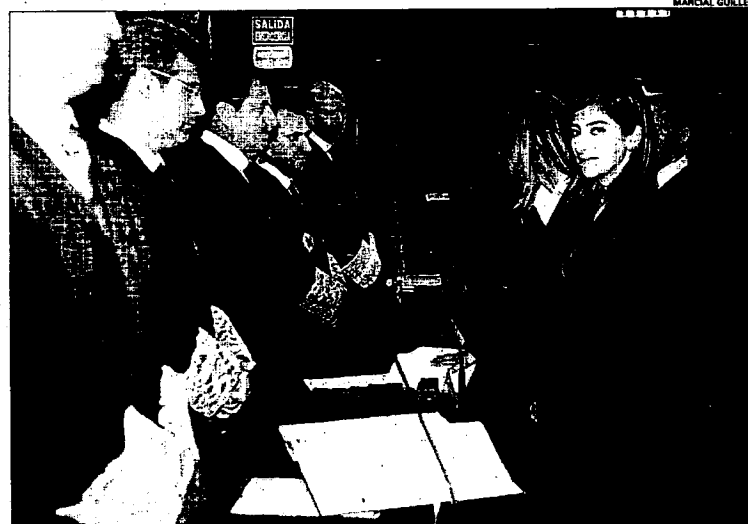
Imagen de la jura de abogados que se celebró el pasado 21 de octubre