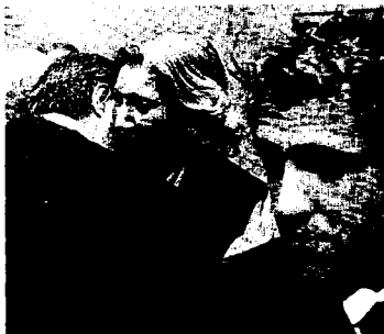
APOYO. La viuda y uno de los hijos.