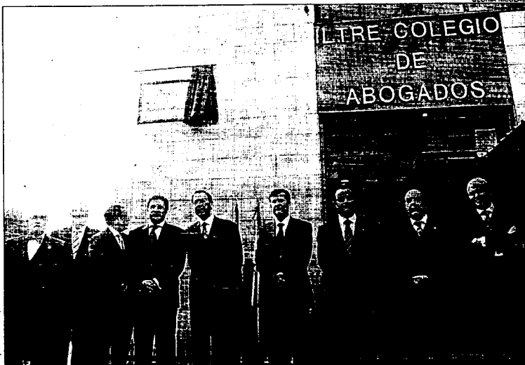
La plaza de la calle La Gloria se llama desde ayer del Colegio Oficial de Abogados