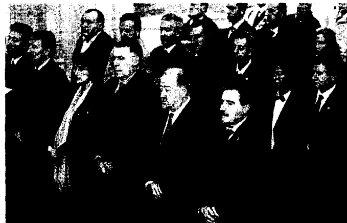
CATEDRAL. Jiménez, Vidau, De Lorenzo y Hontañón.

Una misa de casi una hora en la que «recordamos a alguien cercano que siempre quiso luchar por la vida», pronunció el arzobispo de Oviedo.