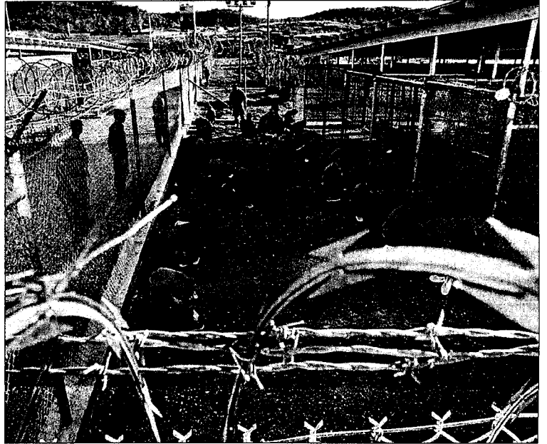
Policías militares de EE UU vigilan a supuestos miembros de Al Qaeda en Guantánamo en 2002.

"El acceso a los presos", dijo, "es un requisito esencial para preservar la independencia de nuestro trabajo". El Pentágono optó al final por mantener su negativa a que los tres investigadores pudieran mantener encuentros privados con los presuntos terroristas de Al Qaeda