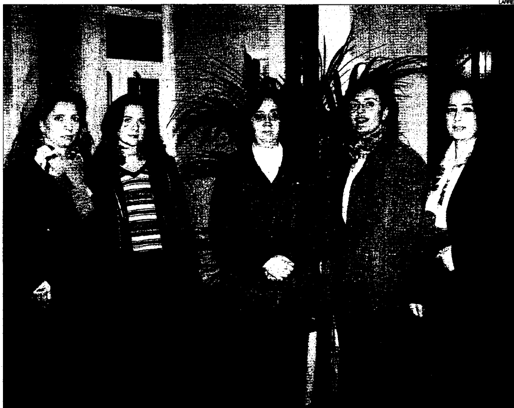
► Representantes de la Comisión Interdisciplinar de Violencia de Género del Colegio de Abogados de Córdoba.

El letrado que asiste a una mujer por violencia de género tiene la obligación de atenderle jurídicamente, y la mujer, como víctima, el derecho de ser defendida por el mismo letrado en todos los procedimientos