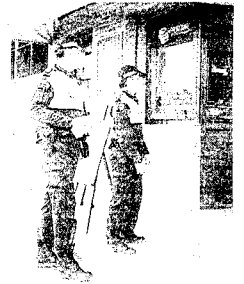
Dos policías de servicio. JOSÉ GONZÁLEZ

El Ayuntamiento ha convocado la oposición para cubrir 50 plazas de Policía Municipal que realizarán labores de seguridad y policía de barrio.