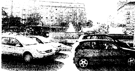
Los cortes de tráfico y las restricciones se mantendrán hasta el año que viene.

La zona más difícil de atravesar fue Marqués de Vadillo, donde las incorporaciones habituales a la M-30 han sido desviadas a través de la calle Antonio López y por el Paseo Quince de Mayo.