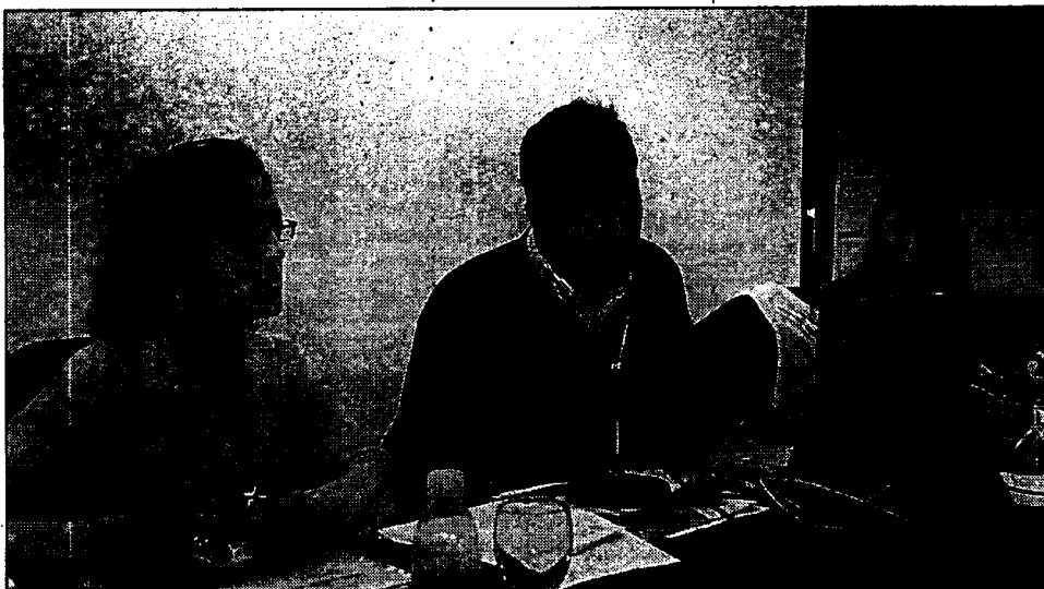
El Museo López-Villaseñor acogió este fin de semana el encuentro de los jóvenes abogados del país

Frente al anteproyecto que no cita la pasantía como una vía de formar al abogado, hace menos de un mes ha salido una normativa que obliga a dar de alta a las personas no colegiadas que se encuentran formándose en los despachos, lo que puede hacer que