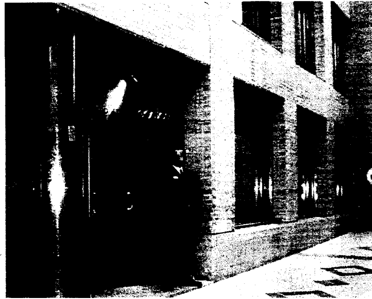
Entrada a la sede del Colegio de Abogados de Valladolid.

En el 900 333 888 se ha sustituido al personal que descolgaba el teléfono por profesionales especializados capacitados para prestar un mejor servicio a las mujeres que marcan el número de la Junta. Los teleoperadores que contestaban habitualmente se encargaban de derivar las llamadas hacia los servicios especializados. Ahora esa atención específica está al otro lado del hilo telefónico sin intermediarios, con lo cual la información gana en rapidez y efectividad.