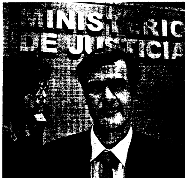
Juan Fernando López Aguilar, en la rueda de prensa