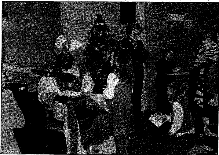
El paje real, en el col·legi d'Advocats.