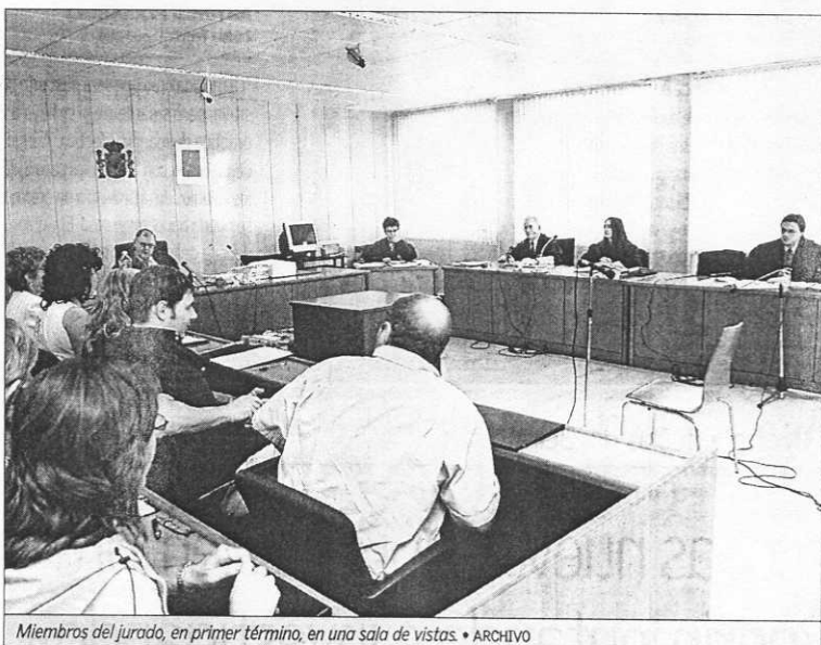
Miembros del jurado, en primer término, en una sala de vistas.