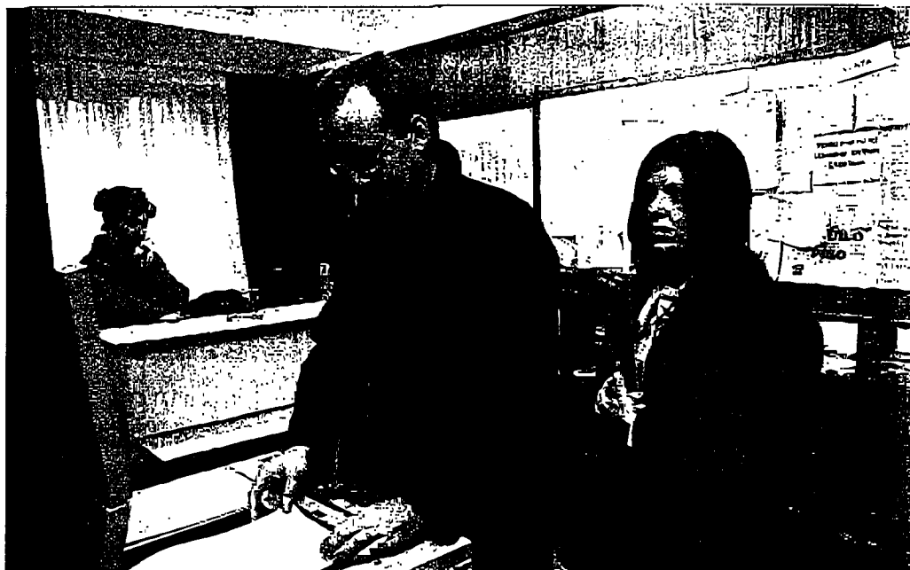
Los abogados hacen cola para fotocopiar porque no hay espacio para otra máquina en su sala del edificio de juzgados.

La situación de falta de espacio alcanza también a los juzga-