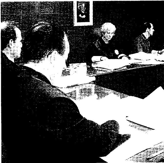
Els retards són la segona queixa dels advocats. A la imatge, una vista als jutjats de Mataró.

Després de les reaccions d'alguns magistrats, els retards de la justícia són el segon motiu de denúncia. Gairebé una de cada cinc queixes dels advocats que formen part del Col·legi d'Advocats de Barcelona estan motivades perquè han esperat durant hores a les portes d'una sala fins que ha començat el judici o perquè el client fa un