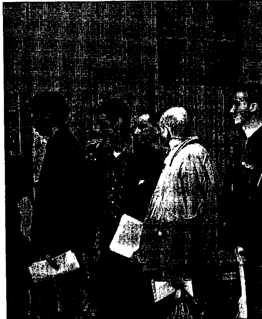
Inmigrantes en cola ante la Oficina de Extranjeros, en una imagen reciente

La propuesta del Secretariado de Migración reclamaba mantener la atención a entidades para el seguimiento de expedientes tramitados con anterioridad a la ley y tres alternativas para la recepción de expedientes por las entidades