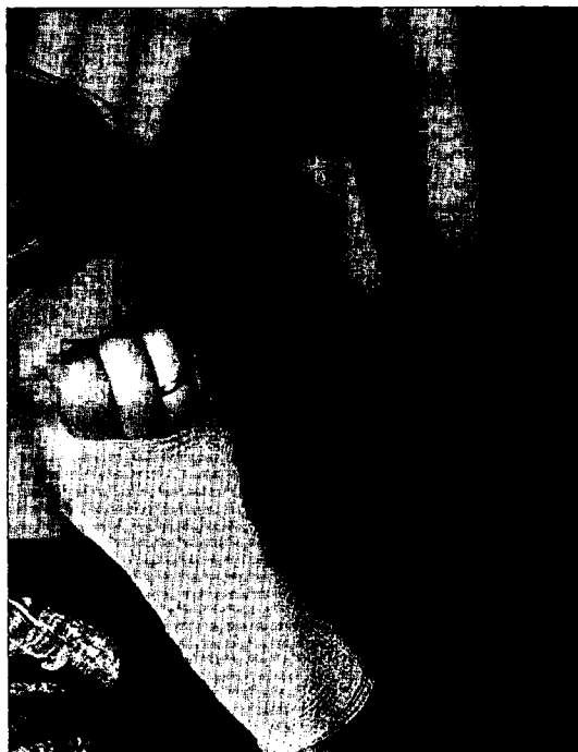
Una víctima de malos tratos, cubriéndose el rostro en su casa de Alicante.

Apenas hubo cinco casos en que la víctima recibió protección penal y civil. En dos de ellos, el juez le concedió la vivienda familiar y en tres, la custodia de los hijos menores. En ninguna de las solicitudes se acordó alguna medida encamina-