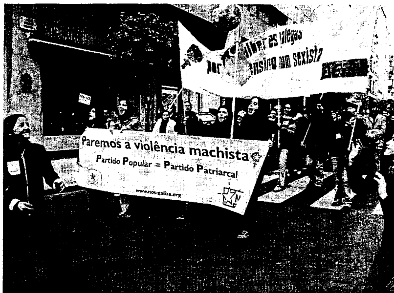
La marcha por las calles de Santiago.

Además la Consellería de Xustiza acaba de firmar recientemente un convenio de colaboración con el Consello da Avogacía Galega para la creación de un turno de oficio específico para la asistencia inmediata y urgente a las víctimas de la violencia doméstica, a las que presta el necesario asesoramiento defendiendo sus intereses en los juicios de faltas. Los Colegios de Abogados deberá dar asesoramiento a las víctimas de la violencia doméstica, asistiéndolas mediante la realización de las actuaciones necesarias para que el juez de instrucción decrete las medidas procedentes, incluida la or-