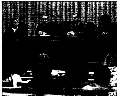
□ 11.00: Edificio sindical: Trabajadores de Valeo con los sindicatos que los informaron.