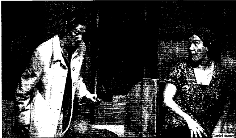
□ 20.30: Teatro Principal: Los actores de la compañía Cuarta Pared interpretan una escena de la obra teatral "Café", con Amanda como protagonista.

□ 10.15: La Delegación provincial de la Consellería de Presidencia fue el escenario escogido para la presentación de una experiencia piloto encaminada a potenciar un mayor y mejor uso de la lengua gallega en la Administración Pública y en sus relaciones con otras entidades y con los ciudadanos. Este proyecto surge con unos objetivos muy claros: contribuir a la concienciación y sensibilización del personal al servicio de la delegación hacia un uso más coherente de la lengua propia como medio de comunicación normal con los ciudadanos, fomentar la reflexión y el compromiso de los funcionarios de promocionar el gallego y mejorar la eficacia y atención al público vinculada al uso del gallego y las nuevas tecnologías. En este sentido prevé, en un primer paso, la constitución de un equipo de normalización en la delegación provincial.