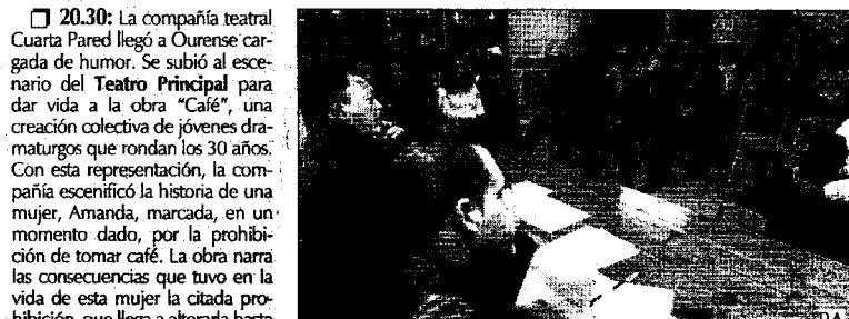
□ 20.00: Seixalbo: Un momento de la asamblea general ordinaria de la Asociación San Breixo.

□ 20.00: La Asociación de San Breixo de Seixalbo celebró ayer su asamblea general ordinaria. En el orden del día de la asamblea figuraba como de uno de los puntos principales dar a conocer a los asociados el balance de la gestión e informe de la directiva, como así se hizo. Asimismo, el acto, que se celebró en el local central de la asociación, sirvió para anunciar la celebración de próximas elecciones debido a la finalización del mandato de la actual directiva.