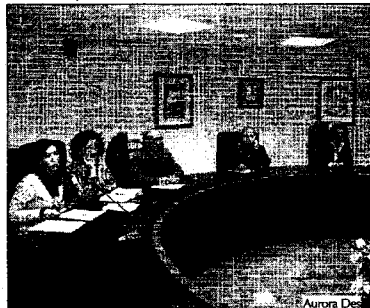
□ 10.15: Edificio de Presidencia: Asistentes a la presentación de la jornada de sensibilización.

□ 11.00: Los trabajadores de Valeo fueron convocados por los sindicatos a una reunión en el Edificio sindical. En la asamblea, tanto la CIG como el sindicato CC.OO. informaron a los ex trabajadores de que la tan solicitada entrevista con la Xunta ya tenía fecha. Los conselleiros de Trabajo e Industria del Gobierno autonómico acaban de confirmar la convocatoria de la reunión solicitada por los afectados para el próximo 1 de marzo. Será en los locales de la Consellería de Industria, en Santiago. El principal tema a abordar en esa reunión será el plan de la Xunta de recolocación de estos trabajadores.