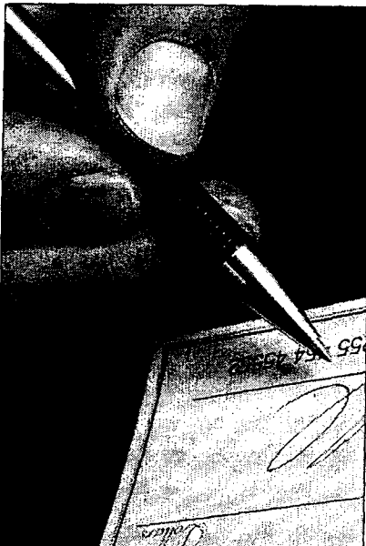
Las peritaciones cobran mayor importancia.

Además, como novedades, este año se incorporan al Libro datos como los criterios orientativos para calcular los honorarios de las pericias, incluidos