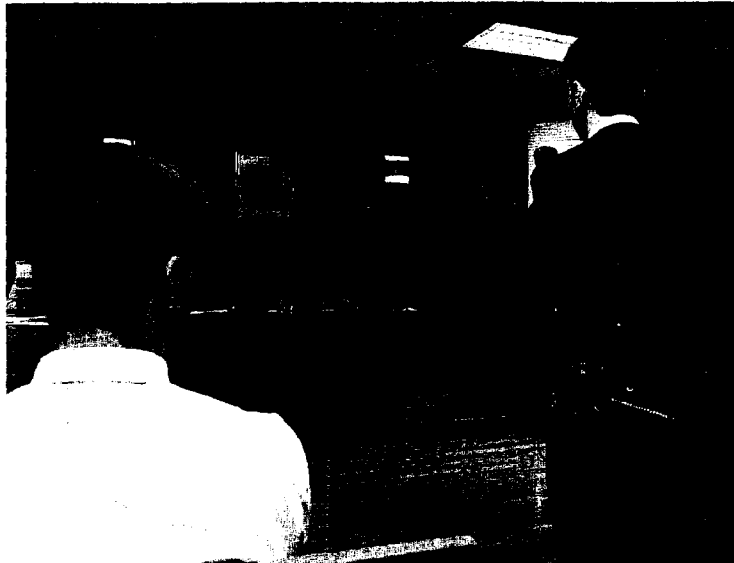
RESPUESTA VELOZ. Celebración de un juicio rápido en la Audiencia de Vitoria.

Aya considera que las vistas urgentes «ahorran tiempo, burocracia y trabajo a medio y largo plazo», y son eficaces para «frenar la repetición de delitos» de poca