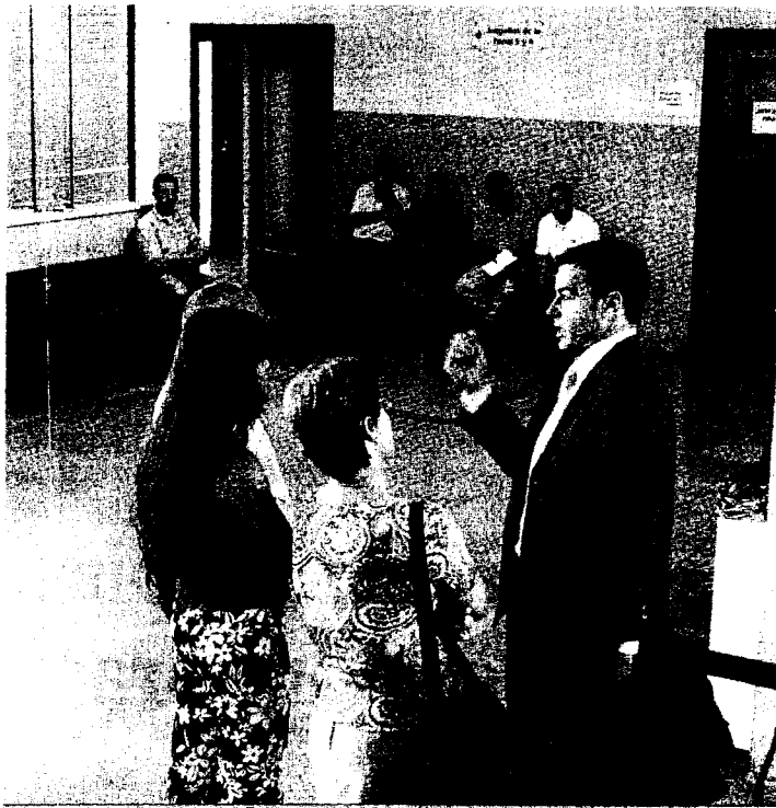
VISTA ORAL. Imagen de uno de los pasillos de los Juzgados de Sevilla.

La reforma también obligaría al desplazamiento de los testigos, incluidos los agentes de Policía que hayan podido participar en las investigaciones del caso en cuestión o en la detención de la persona a la que se imputa el delito. Si se tiene en cuenta que la Audiencia de Sevilla tramita anualmente más de 4.000 asuntos penales y que muchos de ellos son susceptibles de ser recurridos, la cifras justificarían la creación de una sala específica en Sevilla, que vendría a completar las salas de lo Social y de lo Contencio-