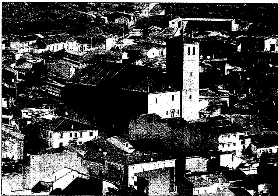
Una imagen de archivo de la localidad de Cebreros.

trata de la creación de un juzgado sino de un partido judicial, que ya existió en Cebreros y que se suprimió por la Ley de Planta y Demarcación en el año 1988. Y en este sentido, incidió en el hecho de que no debe ser una decisión precipitada, «que hay que partir de lo que sucedió cuando desapareció y ver lo que ha cambiado para poder valorarlo».