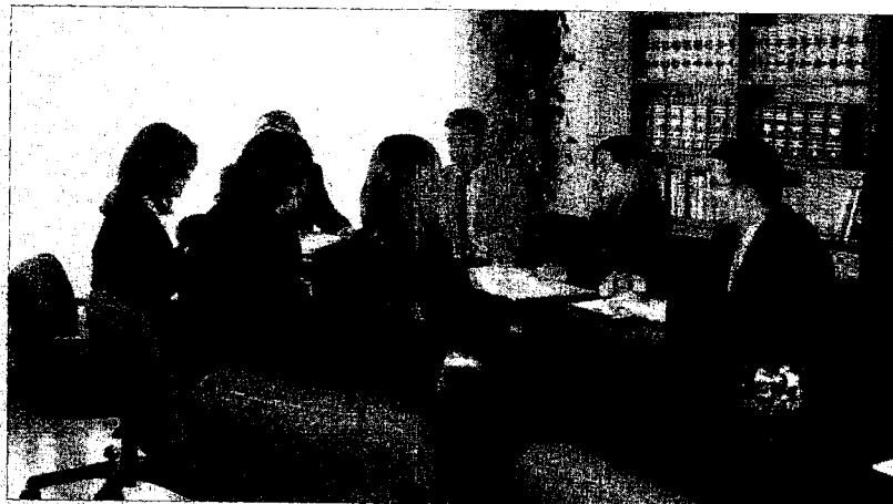
Un grup d'advocats reunits a la seu de Barcelona del bufet Lexland

Ara bé, el pas següent en la internacionalització és l'obertura d'oficines pròpies a l'exterior i això, ara com ara, sembla un tema reservat als grans bufets. Al principi de febrer, el bufet Roca i Junyent -el tercer de l'Estat en facturació- anunciava que en uns quants mesos obriria una oficina de representació a Nova York i una altra a la Xina, aquesta en un termini encara no especificat. El responsable d'Internaciona-