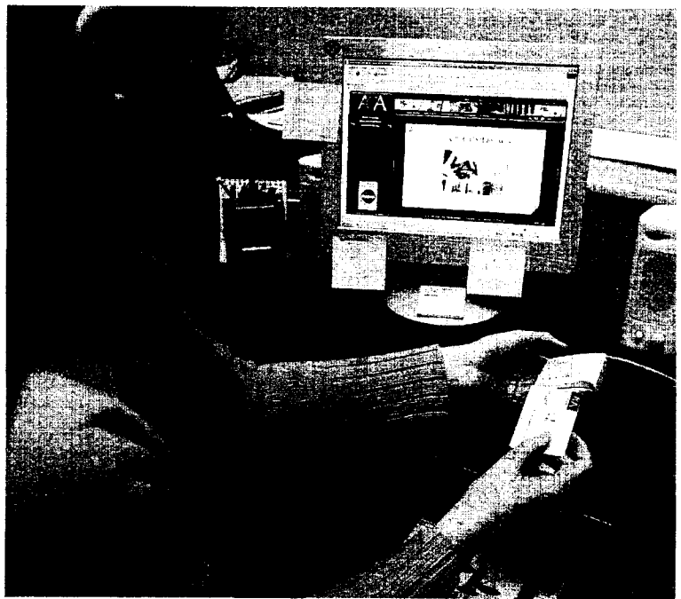
EL SISTEMA. Una empleada del Colegio de Abogados de Granada utiliza su nuevo carné.