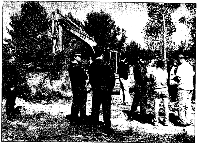
Militantes anti-autopista pararon ayer las obras en Can Pep Xico.

El Supremo también se ha mostrado flexible respecto a la motivación de las órdenes y ha admitido que si en el expediente del sin papeles existen estos datos que justifiquen la medida, no es necesario que la delegación de Gobierno los haga constar expresamente en la resolución donde se comunica la expulsión.