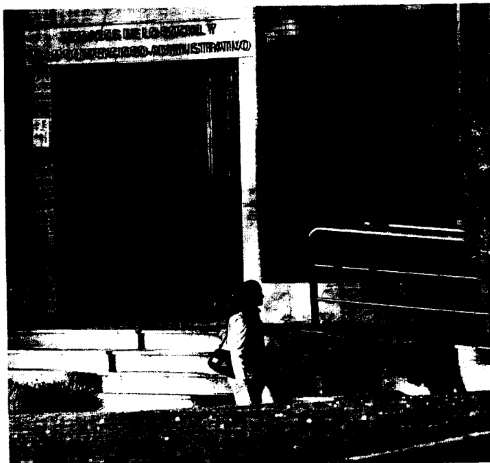
SEDE. Puerta de acceso al juzgado de lo Mercantil de Oviedo.

«Ha de prevalecer siempre el interés del justiciable»