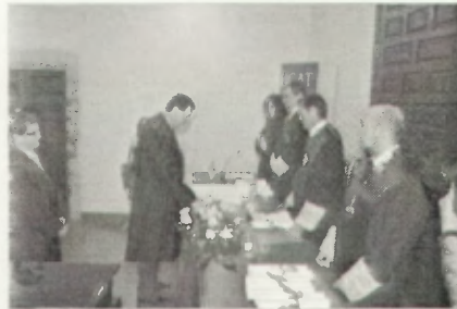
Uno de los nuevos colegiados en el momento de hacer su juramento.