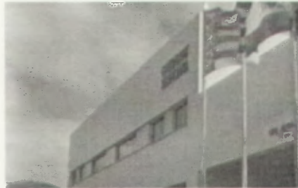
El Palacio de Justicia ubicado en la villa juguetera.