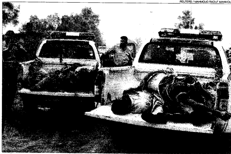
► Dos coches policiales retiran cadáveres con signos de tortura en el barrio de Hai al Shaab, en Bagdad.

Tampoco ayuda mucho que, como denuncia Göring, «la condena más severa impuesta hasta la fecha por una muerte relacionada con tortura bajo custodia estadounidense ha sido de cinco meses. La misma que se impone en EEUU a una persona por robar una bicicleta.»