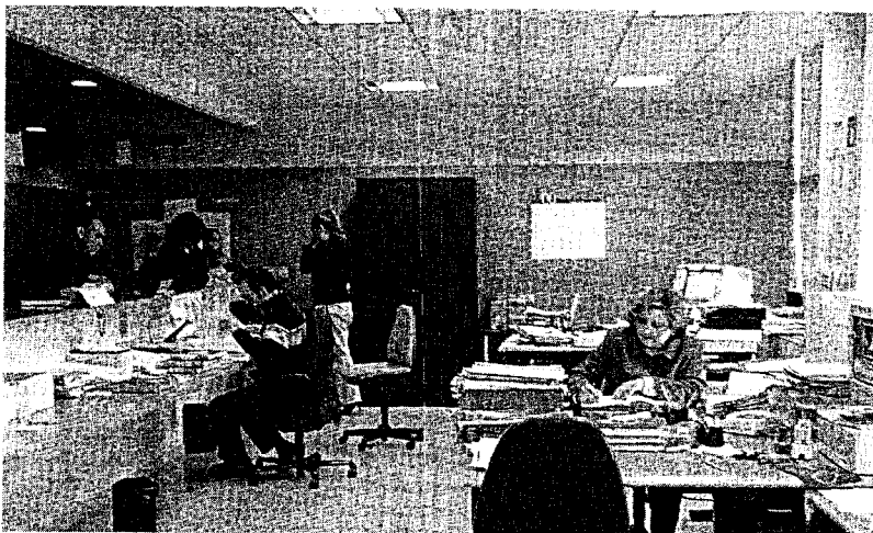
En los Juzgados de Sabadell, la proporción de tramitaciones se ha alterado en los últimos 6 meses

El dato coincide con el principio de la aplicación de la modificación de la Ley 15/2005 en julio del año pasado y que regula las rupturas matrimoniales, agilizando el proceso.