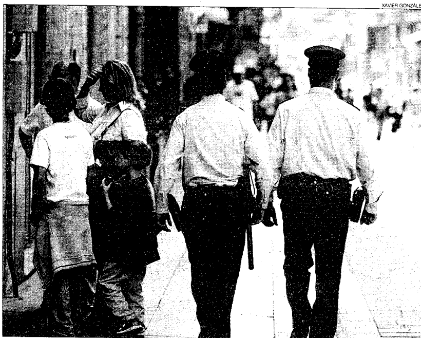
► Dos mossos patrullan por la céntrica calle de Ferran, de Barcelona, el pasado sábado.

PREOCUPACIÓN // «Reconozco que hay una cierta adolescencia policial», argumentó el jefe de Barcelona para, a renglón seguido, detallar los motivos: «La plantilla es muy joven y trabaja con ciudadanos que no reconocen a los mossos la misma autoridad que a otros cuerpos policiales». A juicio de Capell, la confluencia de estos