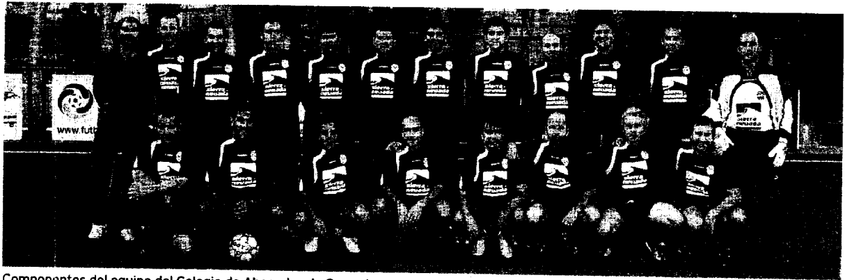
Componentes del equipo del Colegio de Abogados de Granada que participa en el Mundial de fútbol.