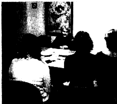
DE ESPALDAS. Mujeres impulsoras de la asociación.

Todas han padecido el maltrato físico y psicológico. Todas siguen sufriendo las amenazas, el acoso telefónico de sus parejas y la mayoría de ellas viven con una espada de damocles que pende sobre sus vidas. Muchas dependen de la eficacia de un auto de alejamiento judicial dictado contra sus agresores. Pero, además, un buen número tiene que mantener a sus hijos, atender sus necesidades afectivas cuando las suyas están hechas añicos, y trabajar en lo que les sale o, incluso, complementar el sueldo con ocupaciones de fines de semana porque no se llega.