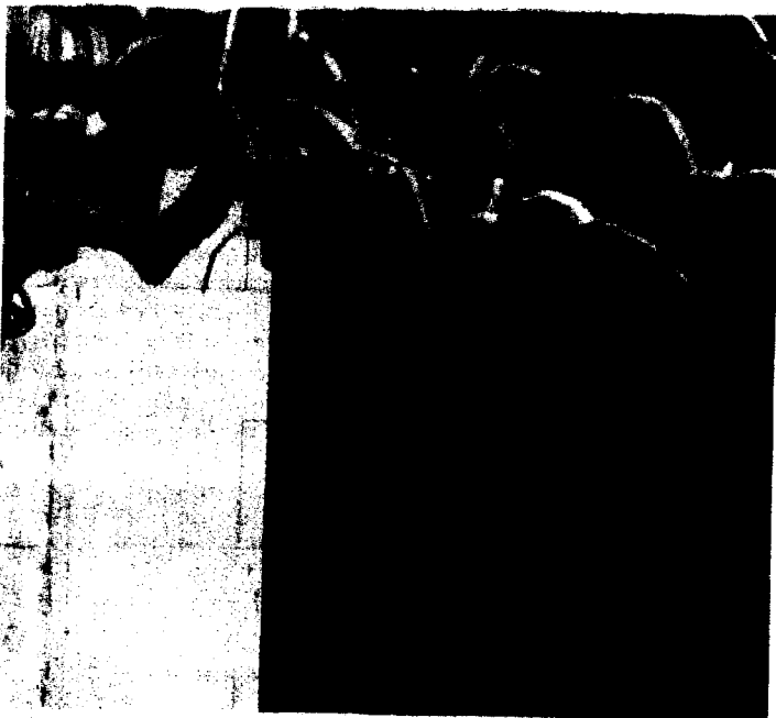
Sede del Colegio de Abogados de Pontevedra. | SALGADO

Objetivo | El objetivo del turno de oficio específico, que no ha hecho más que empezar a funcionar en Pontevedra, es lograr que las víctimas puedan contar con asistencia letrada gratuita y especializada desde el primer momento. La Consellería de Xustiza que dirige Xesús Palmou acordó destinar 24.000 euros a la puesta en marcha de la iniciativa, que serán gestionados y distribuidos como compensación económica entre los siete colegios de abogados