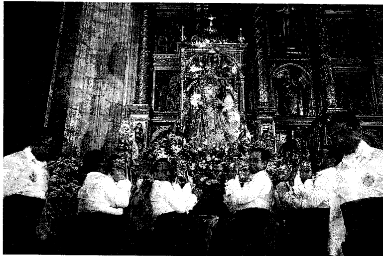
La cuadrilla de santeros prepara en el altar de la parroquia de San Mateo la procesión de subida de la Virgen de Araceli a su santuario de Aras.