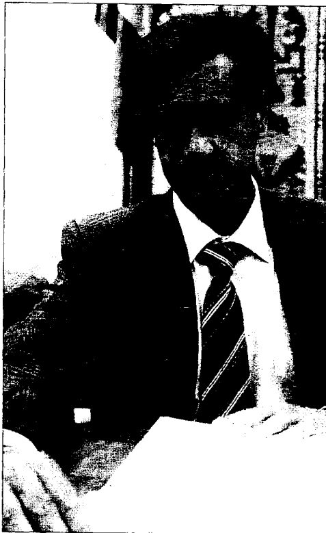
El ministro de Justicia, Juan Fernando López Aguilar.

Precisamente, los sindicatos convocaron ayer a la huelga a los trabajadores de la DGT todos los miércoles y jueves del mes de julio por considerar difícil poner en práctica el nuevo sistema «dada la escasez de medios materiales» que padecen. Las reformas anunciadas tienen la intención de reforzar la eficacia del nuevo carné.