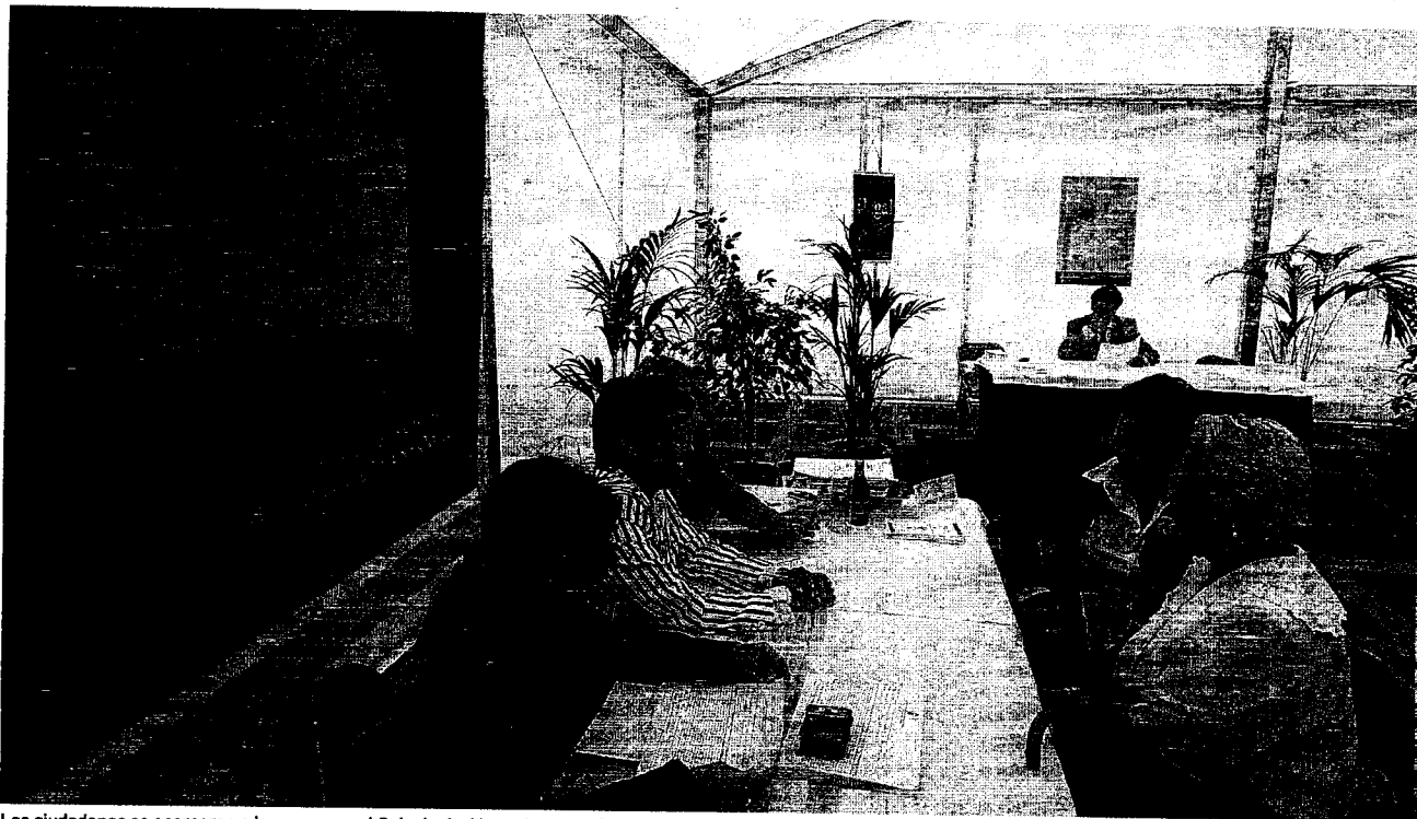
Los ciudadanos se acercaron a la carpa que el Colegio de Abogados montó en la Plaza de Pombo para formular consultas de carácter jurídico. / MIGUEL DE LAS CUEVAS