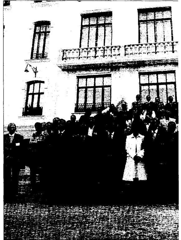
Fotografía de familia de los asistentes a las jornadas de Práctica Jurídica.

Hasta ahora la periodicidad de esta prueba era de una vez año y su convocatoria igual para todo el territorio (hora y día), no obstante, desde las XXV Jornadas podrán