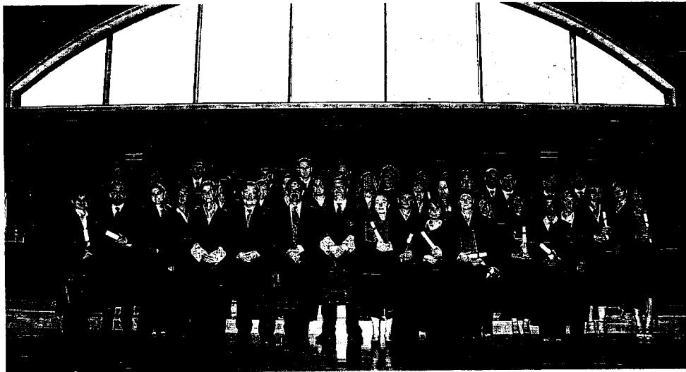
Los nuevos abogados posaron para la foto de familia con la decana del Colegio y los presidentes del Gobierno, Parlamento y TSJC.