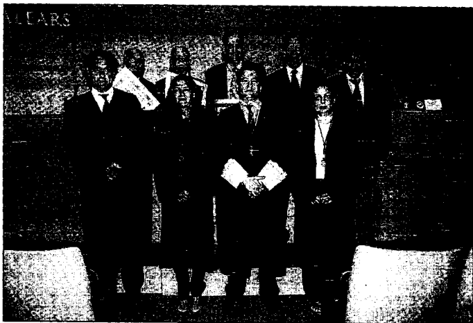
Los abogados que han cumplido 50 años de actividad, detrás de directivos del colegio.