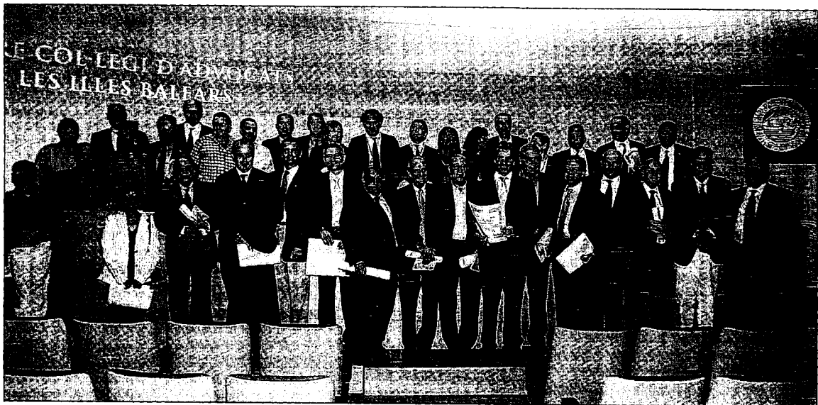
Foto de grupo de los letrados que han cumplido 25 años como colegiados.