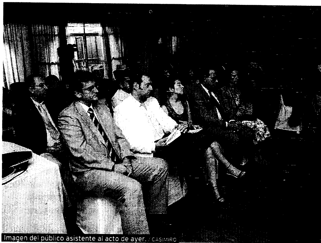
Imagen del público asistente al acto de ayer.