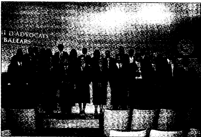
Los nuevos letrados, en el acto celebrado ayer en el Colegio de Abogados.