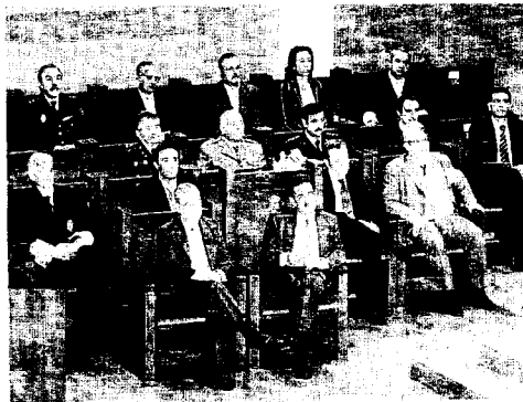
Las autoridades civiles, judiciales y militares.

A los nuevos abogados, la decana les dijo que «el éxito profesional se identifica con el logro de la Justicia, la fidelidad a vosotros mismos -en el sentido shakespeariano-, el cumplimiento estricto de las Normas Deontológicas, el estudio profundo del Derecho aplicable y la dedicación sin reservas a los legítimos intereses de vuestros clientes sin halagos innecesarios ni recriminaciones extemporáneas».