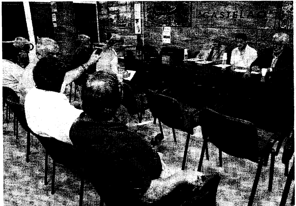
El local social de la federación 'Castelao' acogió ayer un acto público sobre el controvertido proyecto de implantar en Vigo un tercer Juzgado de lo Mercantil que abarcará buena parte de la actual jurisdicción de los de Pontevedra.

El decano del Colegio de Procuradores defiende las mismas tesis que su homólogo del Colegio de Abogados. No duda en tildar de "absoluto desfase" un Juzgado Mercantil en la ciudad olívica.