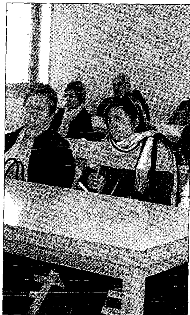
■ Destinan 16.000 euros.

La colaboración entre los firmantes permite a las mujeres del medio rural almeriense contar con información y asesoramiento jurídico sobre sus derechos, particularmente en el caso de que sean víctimas de violencia en el ámbito doméstico. Ante las dificultades con las que se encuentran las mujeres