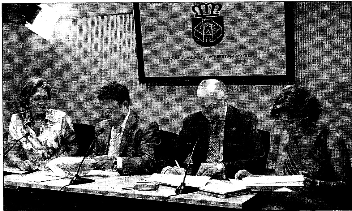
El alcalde de Ciudad Real y el decano del Colegio de Abogados, durante la firma del convenio

BIENESTAR SOCIAL RESPONDE A LAS DEMANDAS DEL FORO DEL MAYOR