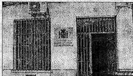
▶ SEDE. Acceso al juzgado de Archidona.

en Antequera, "no va más allá de año y medio, esa movilidad -añade- va en perjuicio de la calidad de la Justicia". En el momento de pronunciarse sobre la distribución de los juzgados en dos partidos judiciales, Miguel Ángel Hortelano manifiesta que "no tiene ningún sentido mantener el de Archidona en las actuales circunstancias: bajo nivel de asuntos y pésima infraestructura". A criterio del Decano "la distancia es mínima, lo coherente sería que este juzgado del municipio archidonés fuera el cuarto de Antequera", si no es así puede darse a "la presión social